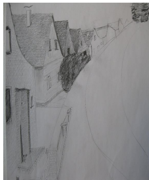
Eine Straße in Lüssum