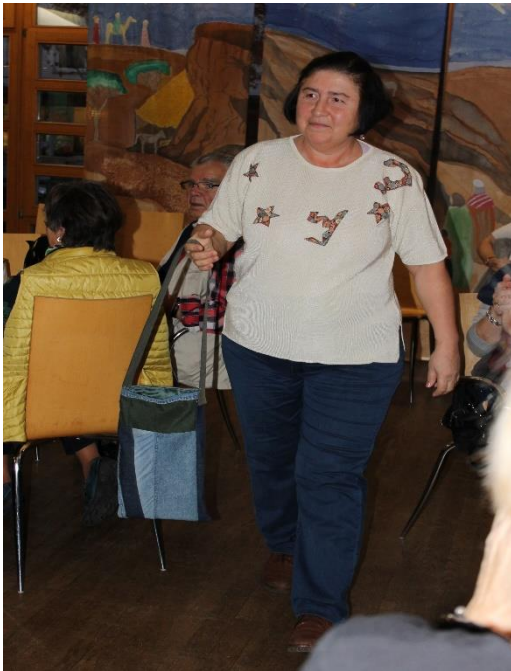
T-Shirt und Tasche

Am Ende des Projektes wurden die Ergebnisse bei einer Modenschau gezeigt.